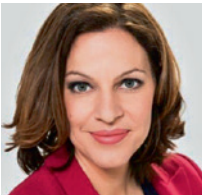
Andrea Vetsch Moderatorin & Reporterin «10vor10», SRF

Nach Studium in Theologie, Germanistik und Psychologie begann sie als Zeitungsjournalistin und Radioreporterin. Ab 2006 beim Schweizer Fernsehen, zuerst als Moderatorin bei der «Rundschau», von 2009 bis Juni 2014 als Moderatorin in der «Arena». Seit 2015 Gesprächsleiterin der Radio-Talk-Sendung «Persönlich» und freie Moderatorin.