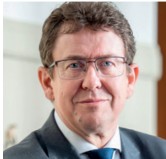
Bundesrat Dr. Albert Rösti Vorsteher des Eidgenössischen Departements für Umwelt, Verkehr, Energie und Kommunikation UVEK

Albert Rösti wurde am 7. Dezember 2022 in den Bundesrat gewählt. Er ist Doktor der technischen Wissenschaften und Ingenieur Agronom. Vor seiner Wahl in den Bundesrat war er Inhaber eines Unternehmens, das in den Bereichen Public Affairs und Projektmanagement tätig ist. Von 2007 bis 2013 war er Direktor der Schweizer Milchproduzenten. 2011 wurde Albert Rösti in den Nationalrat gewählt. Von 2016 bis 2019 war er Präsident der Schweizerischen Volkspartei SVP.