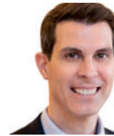
Thierry Burkart Rechtsanwalt, Ständerat und Präsident der FDP.Die Liberalen