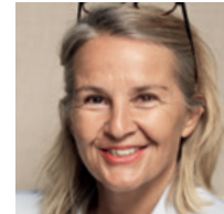
Sonja Hasler Moderatorin beim SRF